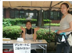
支援ボランティアスタッフ

6月11日は、被災地応援プロジェクト第二弾としてフリーマーケットとコンサートを開催しました。テーマは、「つながろう ころところ」です。第一弾の「たちあげコンサート」で要望が多くあり、認知症家族会やヘルパー養成講座の卒業生の方々、また地域のボランティアの方々のご協力を得て実現しました。雨天にも関わらず、300名近くの方にご来場いただけました。ボランティアスタッフの方々は、当日知り合ったばかりとは思えない和やかな雰囲気で作業を行っていました。これもひとえに、被災地のために何かしたいという「おもい」を共有しているからでしょう。皆さんの被災地への強い気持ちを感じました。