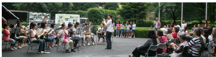
杉並区立富士見丘中学校 吹奏楽部

2時46分になると、全員で黙とうをささげました。現地でのボランティア活動の様子が紹介されると、被災地での深刻な状況に会場全体が打ちのめされました。しかしその後、吹奏楽部部員達が震災復興の気持ちを込めて「愛は勝つ」を演奏し始めると、会場は勇気づけられて最後は万雷の拍手に包まれ、参加者一同胸が熱くなりました。