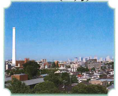
ひまわり屋上からの景色