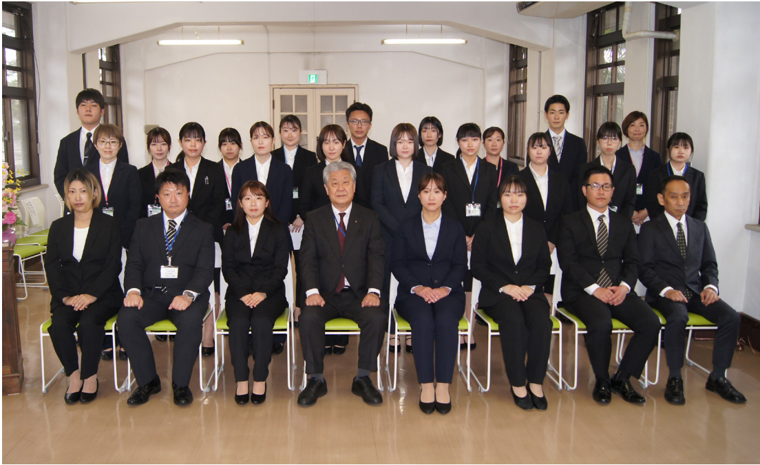
令和六年度四月一日採用辞令交付記念撮影

令和 6 年 4 月発行 【発行者】〒168-8510 東京都杉並区高井戸西 1-12-1 社会福祉法人 浴風会 【編集者】浴風会本部事務局