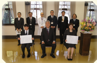
勤続 30 年 職員