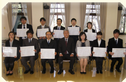
勤続 20 年 職員