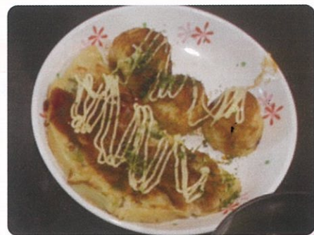
たこ焼き・お好み焼き