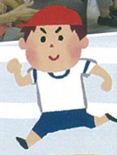
アイスパーティー