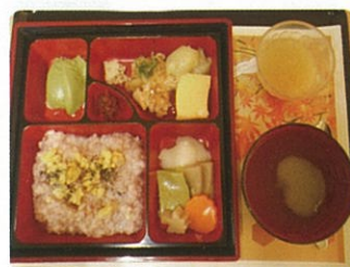
ゴクキザミ食(ソフト食)