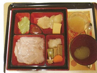
ミキサー食(ソフト食)