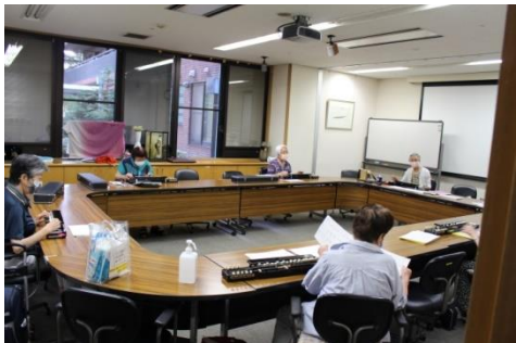
「水墨画」のクラブが復活しました。

感染症に気を付けながらクラブ活動の「大正琴」「書道」が活動再開しました。ソーシャルディスタンスと換気、消毒に気を付けています。